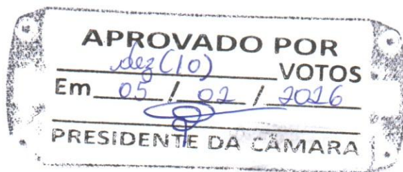
FRANCISCO SOUTO DE VASCONCELOS JUNIOR Prefeito Municipal